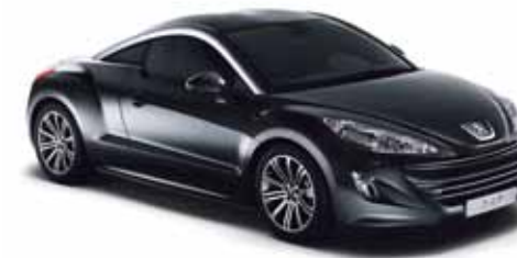
Preto Perla Nera